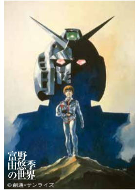
安彦良和 イラスト原画 『機動戦士ガンダム(劇場版)』(ポスター)

富野監督といえばガンダム、ガンダムといえばメカアクション、というイメージをお持ちの方が多くでしょう。ロボットどうしの戦闘に重ねて、人と人との感情のぶつかり合いや共鳴を表現する演出、そこで展開される独特のセリフ回しなどが、富野作品の魅力です。