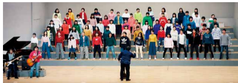
本番公演でのステージの様子

倉持裕 KURAMOCHI YUTAKA 2000年、劇団ペンギンフルベイルパイルズを旗揚げ、主宰。以降すべての劇団作品の脚本・演出を手がける。『ワンマン・ショー』にて第48回岸田國士戯曲賞受賞。舞台脚本・演出作品多数、近年ではTVドラマの脚本も手がけ、活動の幅を広げている。