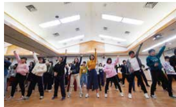
練習中の様子

とりわけ音楽家を多く輩出している県です。もともと持っている声に恵まれている地域だと思います。東部だけではなく、島根県全体が「合唱県」「音楽県」になることを私は願っています。もちろん、コンクールで輝かしい成績をおさめることも素晴らしいことですが、それとは少し違うムーブメントである「ネクスト・クワイア」が、その大きな契機になれば、こんなに嬉しいことはありません。パワー全開の「ネクスト・クワイア」を応援してください!