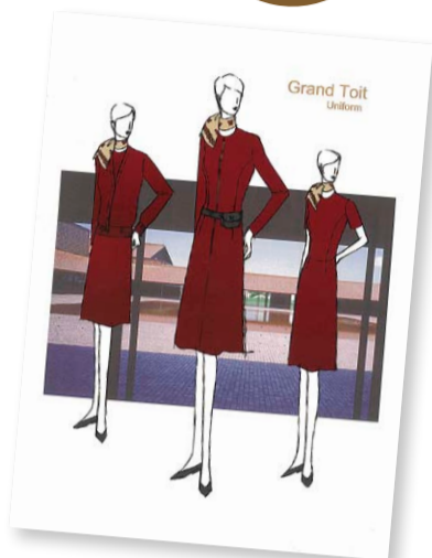
森英恵さんの手による新制服スケッチ

新制服は、2015年10月11日に開催された「グラントワ開館10周年記念式典」で披露されました。ワンピースの新制服はグラントワを象徴する石州瓦をイメージしたシックなワインレッドの色調で、森さん曰く「石州