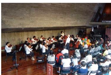
グラントワ弦楽合奏団によるミニコンサートの様子

今回もゲストに東京アーティスト合奏団をお迎えします。単独ステージもあり一流アーティストの演奏をお楽しみいただけます。