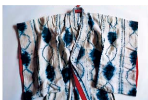
石内都《藍の絞り染め木綿着物の袴下にモスリンの紐の背守り》 2013年 作家蔵(着物は鳴海友子氏蔵)