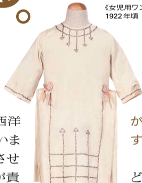
《女児用ワンピース・ドレス》1922年頃 田中本家博物館蔵