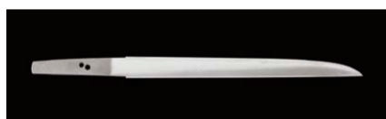
《短刀 銘「吉則」》室町時代 島根県立古代史学歴史博物館蔵

特別展 「日本刀の美—室町時代から江戸時代まで—」 3月31日(土)~5月14日(月)