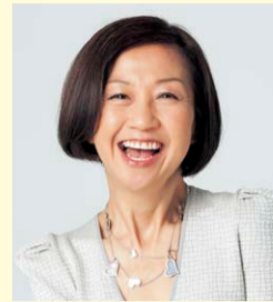
綾戸智恵 (ジャズシンガー)