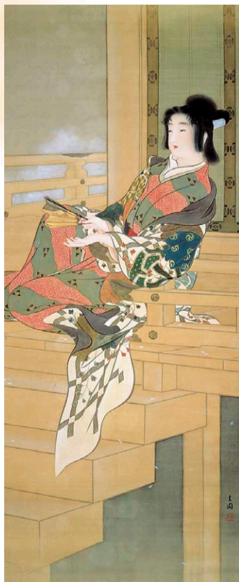
池田蕉園《夜の祭》明治42年