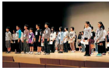
オーディション風景

※あてがき: 脚本家があらかじめ、配役を想定したうえで、その役者の個性に合わせて登場人物を描くこと