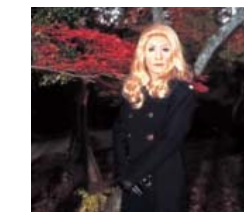
森村泰昌 《セルフ・ポートレート(女優)ノドヌーブとしての私・2》

ゴッホやフェルメールなど、巨匠の有名絵画作品に自ら入り込み、登場人物になりきったセルフ・ポートレートを作り続け