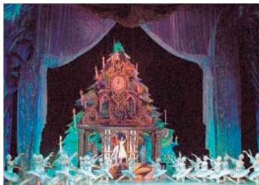
「くるみ割り人形」公演の様子

て「邦楽アウトリーチ事業」が始まりました。これは「邦楽塾・キッズ邦楽塾」の実績が評価されたもので、全国に先駆けて実施されるものです。初年度は、島根県文化振興財団が主体となり、12月から1月にかけて益田市・津和野町・雲南市での学校公演を、またその周辺の施設でワークショップを、1月にグラントワ小ホールで全体演奏会を、それぞれおこなうものです。最後の話題は、グラントワ誕生日におこなわれる「きんざいデー」です。ホールでバックステージツアーを体験し、美術館では「千年の祈り 石見の仏像」展に触れ、そして中庭を中心とした施設全体の大冒険などのイベントに参加するなど、皆さんご自身で楽しみをコラボレーションしてみてください。[V.A]