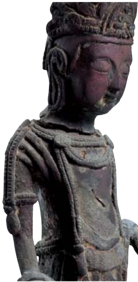
【観音菩薩立像】美郷町・定徳寺