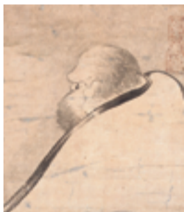
そたゆうはく 曾田友栢 だるます 《達磨図》 桃山から江戸時代 紙本墨画

達磨さんです。でもこの達磨さんちょっとへん。ほとんど後ろを向いているのに、目だけはこっちをにらんでいます。達磨