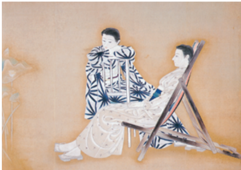
橋本明治 《運を聴く》 1936年 (島根県立石見美術館)

日本画では中村大三郎や島根県浜田市出身の橋本明治、洋画では小出楯重や小磯良平といった昭和の大家の作品が並びます。あわせてモガの生活を彩ったファッション雑誌や化粧品などの広告なども展示します。竹久夢二の『婦人クラブ』や、山名文夫の資生堂の広告など、今でも充分通用するステキなイラストもあります。