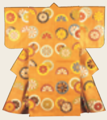
茶地青海波源氏車模様厚板 江戸時代(18世紀) 国立能楽堂

国立能楽堂の所蔵する能装束、能面、狂言装束、狂言面のほか絵画文献等資料を一挙公開。ふだん近づいて見ることのできない華麗な装束や、神秘的な面をじっくり鑑賞できる貴重な機会です。室町時代以来600年の伝統を誇る日本の美意識を感じてください。