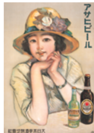
多田北島 《アサヒビールポスター》 (祐生出合いの館)

昭和初期の文化を色々な角度から紹介します。講演会では文学を、コンサートでは歌を、そしてレストランでは当時の味を、ぜひ楽しんでください。子どもたちには、モダンガールの心意気になって、オリジナルの着物を作って着こなすワークショップに挑戦してもらいます。この春は、モガの世界にどっぷり浸かってください!