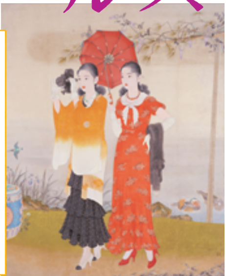
榎本千花俊 《池畔春興》 昭和7年 (島根県立石見美術館)

[開館時間] 10:00-18:30 (展示室への入場は18:00まで) [休館日] 毎週火曜日