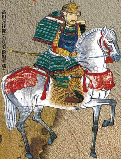
益田元祥像(石見美術館所蔵)