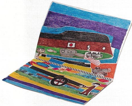
【銀賞】『スケッチブック』 竹内 保晴 / 2020