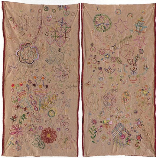
【金賞】『メルヘンのれん』 横田 佳代子 / 2020