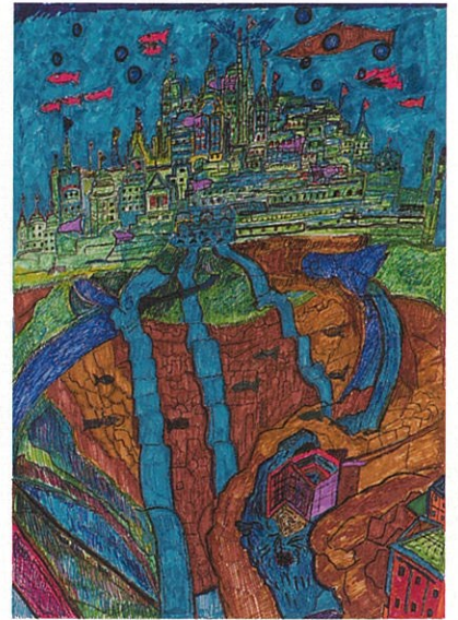
【銀賞】『海の中の都』 鹿島 大佑 / 2020