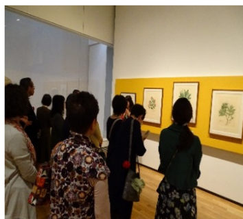
トークの風景 (学芸員)

3人目は市内女性のお客様。知人の方の生花展を覗に来られたそうです。墨絵は好きで10年前に中国へ6泊する機会があり、中国での暮らし、食事、風景などを話して下さいました。墨絵が上手に描けるかなと思う気持ちで筆を買って帰られたそうですが、まだ使っていないと笑っておられました(私もその様な経験があるので気持ちがよくわかりました)。展示室を出られる際「ありがとうございます」と声をかけて下さり大変嬉しく思いました。作品を鑑賞しながらいろんな話が出来るとも心に残る11月の展示室Aでした。「ありがとうございます」