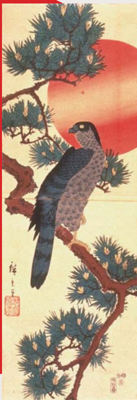
歌川広重《白の出松に鷹》 1830(54天保)嘉永期〔前期展示〕