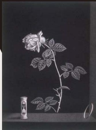
長谷川 潔《薔薇と時》 1961(昭和36)年〔後期展示〕