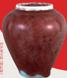
河井寛次郎《緋紅餅》 1921(大正10)年頃