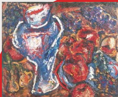
小泉 清《静物》 1949(昭和24)年