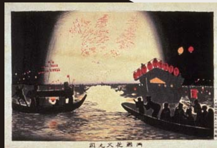
小林清親《两国花火之図》 1880(明治13)年〔前期展示〕