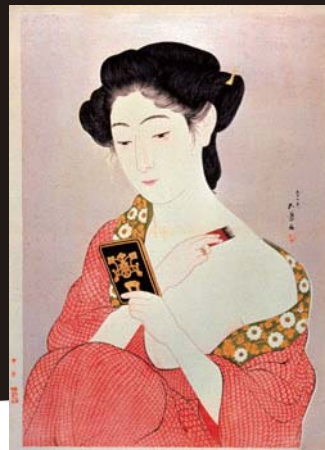
橋口五葉《化粧の女》 1918(大正7)年〔前期展示〕