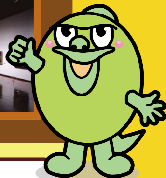
グラントワ・マスコット・キャラクター「オロチくん」

雑木林に囲まれた家で、野菜やフルーツを育てながらスローライフを送る夫婦を追ったドキュメンタリー。日本人が忘れかけている本当の豊かさを見つめ直す作品です。