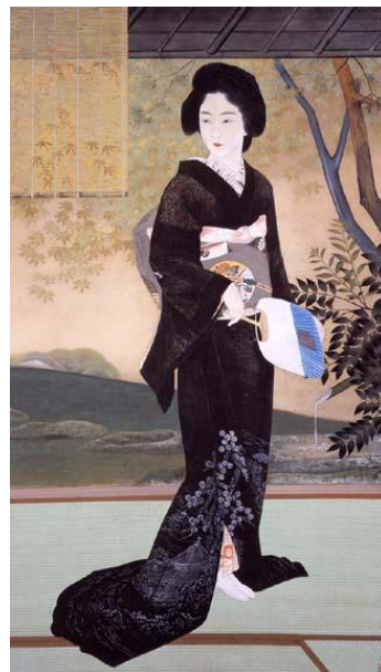
(中) 小早川清《旗亭涼宵》 粋な装いの芸者の凛とした立ち姿。絹の着物の着こなしが見事です。