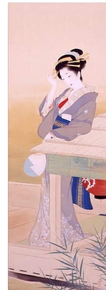
(右) 伊藤小坡《舟中納涼之図》 屋形船の宴会を抜けてほっと一息つく芸者。透ける着物が涼しげです。