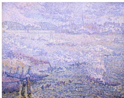
ポール・シニャック 《ロッテルダム、蒸気》 1906 年 島根県立美術館

島根県内にある優れた美術作品を一堂に集め、〈点と線〉、〈かたち〉、〈視点〉、〈光と影〉、〈いろ〉という要素を手掛かりに見ていく展覧会。造形作品をめぐる基本的な要素とともに、体感できるわかりやすい資料も展示し、美術作品をじっくり見て、味わう楽しみを実感できる内容です。学校の授業になぞらえた構成にしており、「絵の見方がわからない」という方や「専門的な知識がない」という方にも楽しんでいただけます。あわせて島根県内の文化財 (重要文化財 1 点、島根県指定文化財 3 点含む) も展示し、地域に根差した文化の魅力も紹介します。