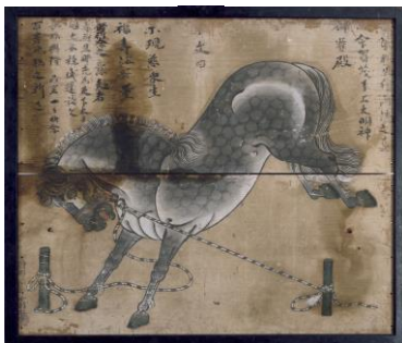
狩野秀頼《神馬図絵馬》 室町時代 1569 年 (永禄 12) 寄進 邑南町・賀茂神社 重要文化財 (前期展示)