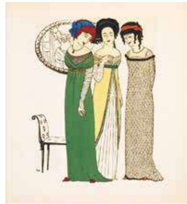
図9『ポール・イリブが描くポール・ボワレのドレス』図版5