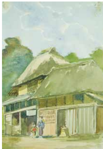
図 24 - 2