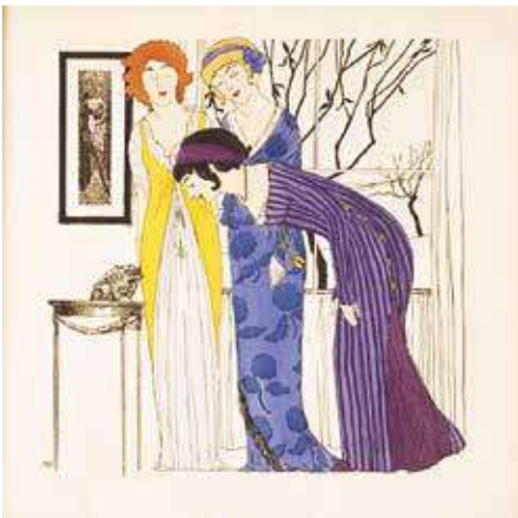
図3 『ポール・イリブが描くポール・ボワレのドレス』図版3