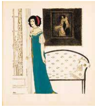
図8『ポール・イリブが描くポール・ボワレのドレス』図版4