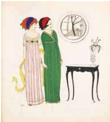
図7『ポール・イリブが描くポール・ボワレのドレス』図版1