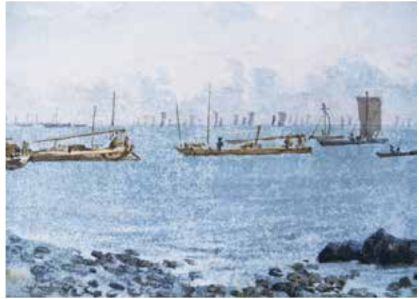
図 22 - 2