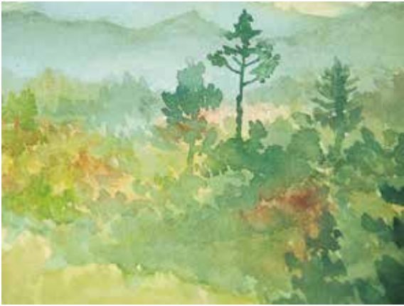
図 24 - 1