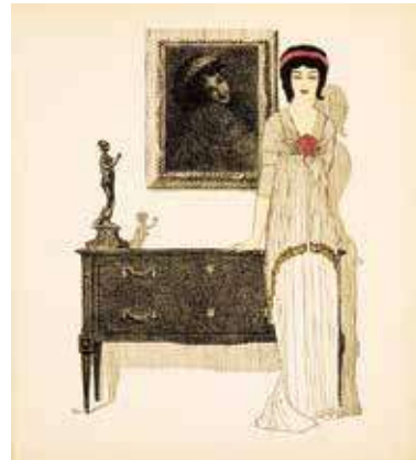
図11『ポール・イリブが描くポール・ボワレのドレス』図版10