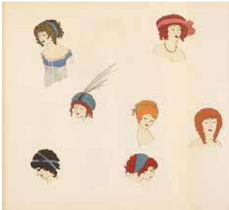
図10『ポール・イリブが描くポール・ボワレのドレス』図版6