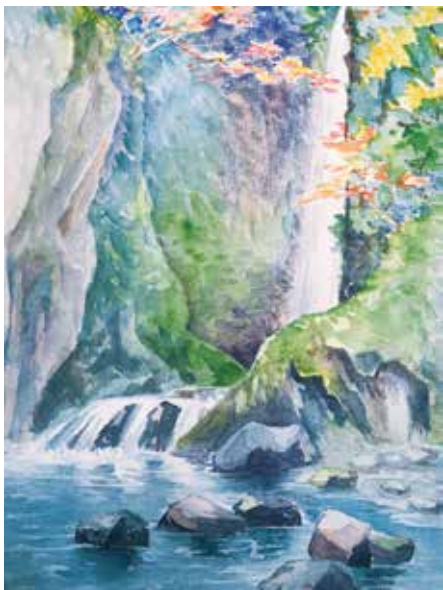
図 25 - 1