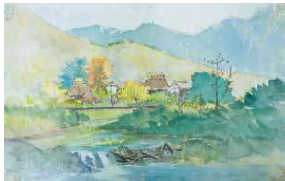
図 25 - 2