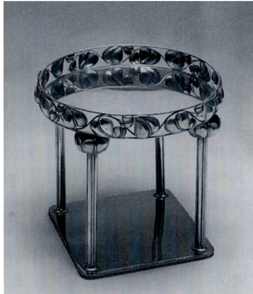
(図1) ヨーゼフ・ホフマン《センターピース》1910年

安田は、オーストリアの工芸の中でもウィーン工房を高く評価していた[10]。ウィーン工房の製品は、室内装飾、婦人の衣服、陶器、金属器、装身具、書物の表紙、婦人携帯品など広範囲にわたっており、斬新さによりその製品は一見してウィーン工房のものと同認められ、オーストリアの流行を左右している。さらに、ウィーン工房は、ベルリンでもファッションショーを開催し、婦人の服装の新流行を作り出し、パリに並んでウィーンが重要なファッションの流行源になっている。ウィーン工房の斬新な意匠は、ホフマンやモーザーら優れた図案家によって考案され、その製品は主として美術的思想ある、凝った人士の間に称揚されている。安田は『建築工藝叢誌』(1914年4月)でウィーン工房のリーダー、ホフマンの作品の写真図版を紹介している(図1)。