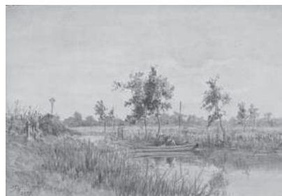
(図3) 大下藤次郎《つり》 水彩、紙 明治28年9月15日 当館蔵