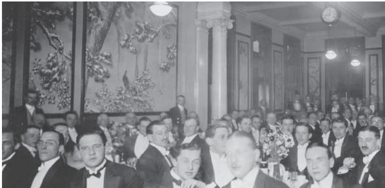
(図11) ロンドン医科大の食堂の晩餐会 背景の壁に和訓の作品