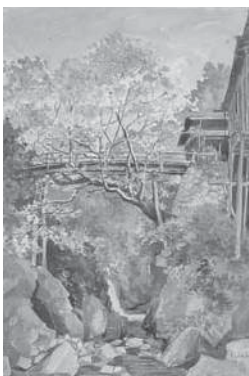
(図7) 大下藤次郎《小丹波》 水彩、紙 明治29年 当館蔵