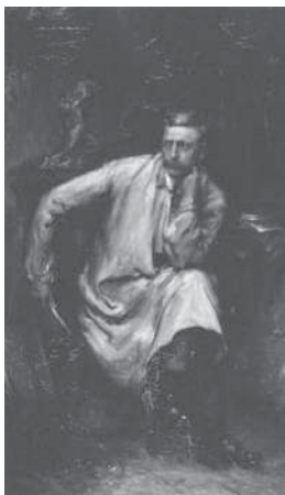
(図5) 彫刻家 1911年 東京国立近代美術館蔵