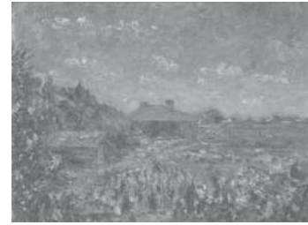
(図10) レナード・ヒルの作品 (油彩)