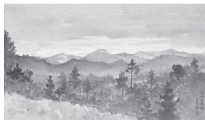
(図4) 大下藤次郎《武州七国峠》 水彩、紙 明治28年11月11日 当館蔵

(後列右より大下、大森安久 太郎、中列右より真野紀太郎、 森脇英雄、大久保雄輔、前列 右より中丸廉一、藤村知子多)