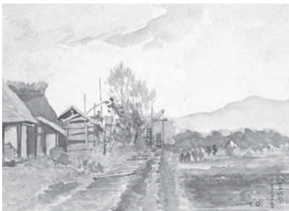
(図6) 大下藤次郎《八王子河原》 水彩、紙 明治28年11月15日 当館蔵