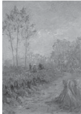
(図1) 大下藤次郎《野の道》 油彩、キャンバス 当館蔵