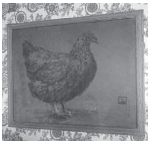
(図8) レナード・ヒルの作品(油彩) 右下に落款のようなマークを入れている

ヒルの和訓への援助はこれだけではなく、ウインチェスター教会を崩落の危機から救つた英雄ウィリアム・ロバート・ウォーカーの肖像(ウインチェスター教会 六一・一×五〇・八cm)にも和訓を推薦したふしが見られ (*)36 、妻子の肖像も依頼している。それが筆者が発見した一九一五年の《レディ・ジャネット・ヒルの肖像》(図12)とその娘マーガレットの肖像(図13)である。