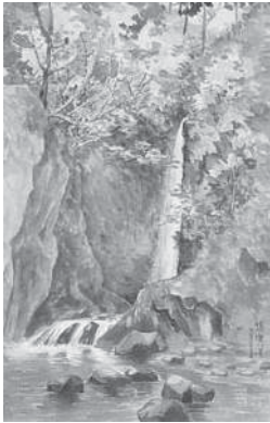
(図5) 大下藤次郎《相州塩川瀑》 水彩、紙 明治28年11月12日 当館蔵