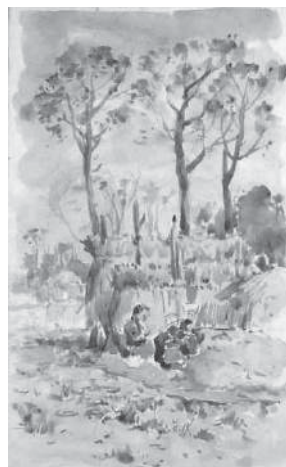
(図2) 原田直次郎「画帳」より 水彩、紙 石橋財団ブリヂストン美術館蔵