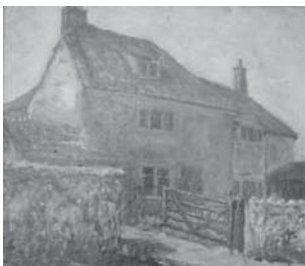
(図9) レナード・ヒルの作品(油彩)