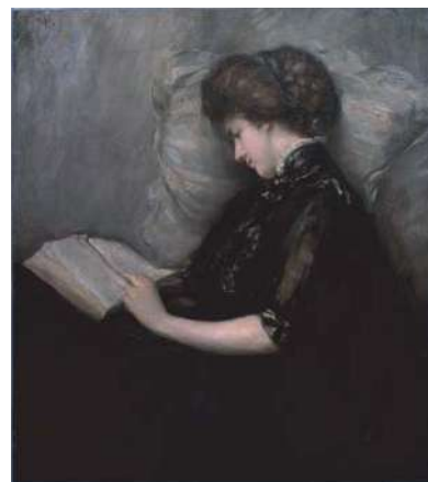
(図2) 美人読詩 1906年 99.5×88.3cm 島根県立美術館蔵