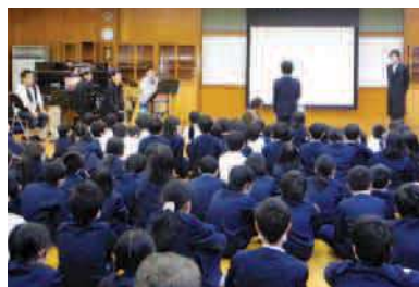
平成25年度 津和野小学校出張公演