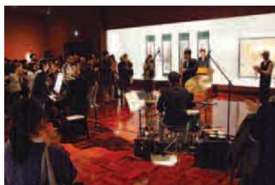
平成23年度「名画をいろいろ話芸と音楽vol.3」