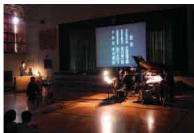
平成24年度 益田小学校出張公演