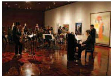
平成22年度「名画をいろいろ話芸と音楽vol.2」