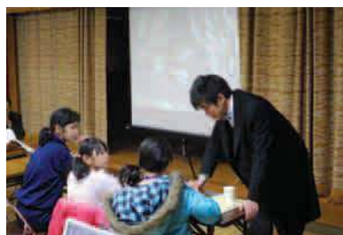
平成23年度 活弁体験ワークショップ