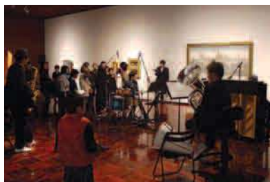
平成25年度「名画をいろいろ話芸と音楽vol.6」