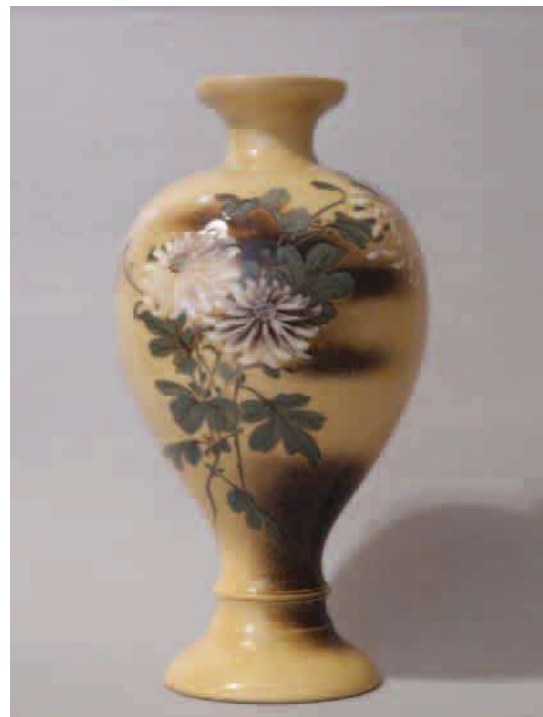
(図1) 初期の釉下彩陶器と考えられる作品 《布志名焼 黄釉釉下彩菊図花瓶》 製陶舎 明治25~35年頃 個人蔵

つまり明治29年頃の布志名焼の輸出陶器は、国内で使用するものをそのまま輸出されるの