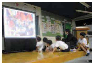
平成25年度 鎌手小学校での絵画鑑賞ワークショップ