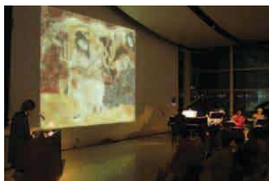
平成25年度「名画をいろいろ話芸と音楽in松江」