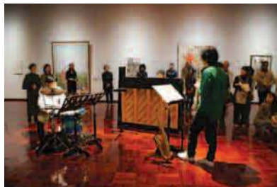
平成21年度「名画をいろいろ話芸と音楽」