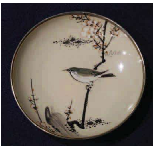
(図3) 安井如苞の絵付と伝えられる作品 《布志名焼 黄釉釉下彩皿》 舟木合名会社 明治32～36年頃 個人蔵