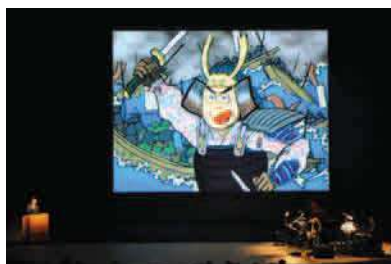
平成24年度「名画をいろいろ話芸と音楽vol.4」