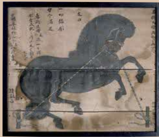
狩野秀頼《神馬図絵馬》永禄12年(1569) 邑南町・賀茂神社蔵 重要文化財【前期展示】