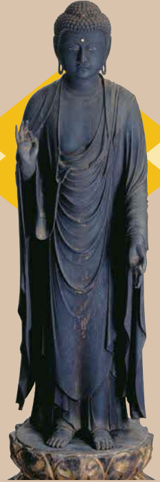
院豪《木造阿弥陀如来立像》 文永7年(1270) 江津市・清泰寺蔵 島根県指定文化財【全期間展示】