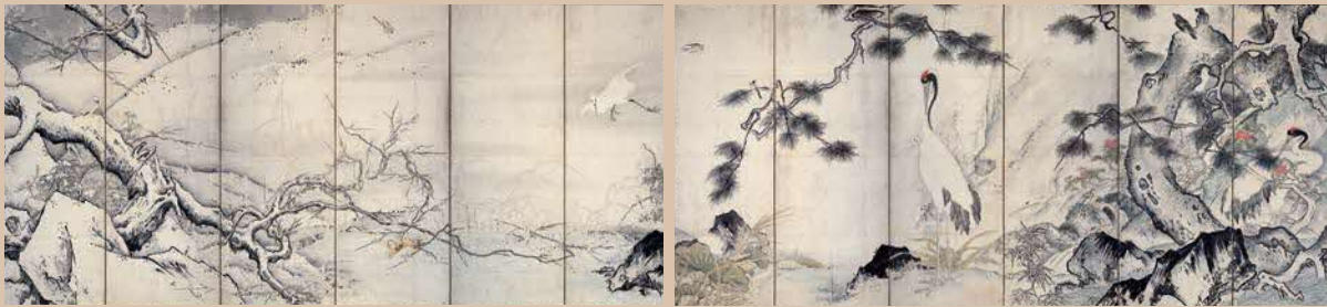
雪舟等楊《四季花鳥図屏風》室町時代・15世紀 京都国立博物館蔵 重要文化財【後期展示】