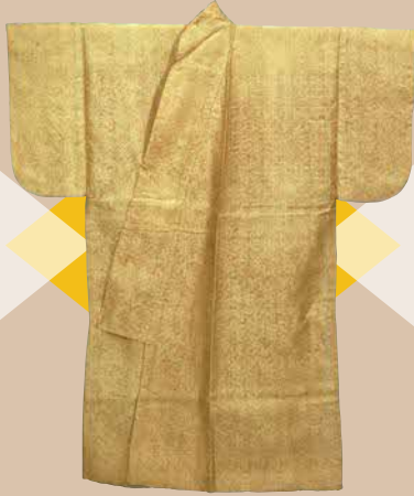
《小袖 白茶地桐竹模様綾》 室町時代・16世紀 東京国立博物館蔵 重要文化財【前期展示】