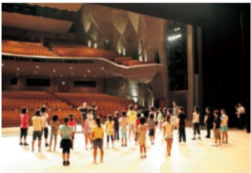
「あいと地球と競売人」オーディションの様子