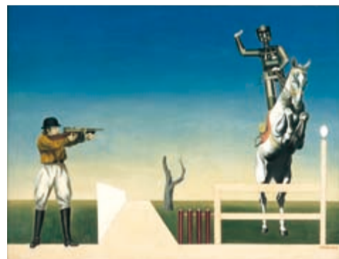
古賀春江「現実線を超える主観的表情」 1931年 西日本新聞社蔵(福岡市美術館寄託)

マに、私たち学芸員が原案を作り、出品作品の1つとしてアニメを制作してもらいました。今の日本でロボットを考えるのに最もふさわしい表現方法が、アニメだと考えたからです。監督はじめ素晴らしいスタッフのおかげで、4分弱と短いながらも素敵な作品ができました。ほかでは見られないものなので、ぜひ会場へお越しください。