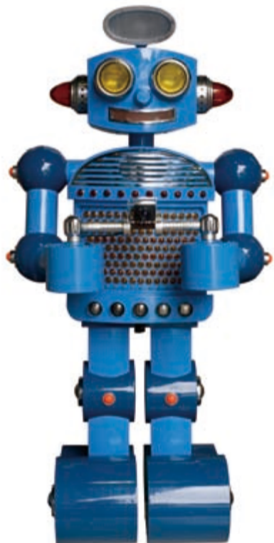
相澤次郎「カメラマンロボット「太郎」君」 1969年 財団法人 日本児童文化研究所蔵