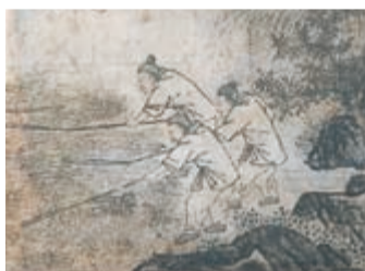
雲谷派 《耕作図屏風》 (部分)

上の写真は農耕の様子を描いた屏風絵の一部です。ここで見ていただきたいのは働く3人の右下にある黒々とした岩です。室町時代に活躍した画僧・雪舟の絵に特徴的なのが、ちょうどこ