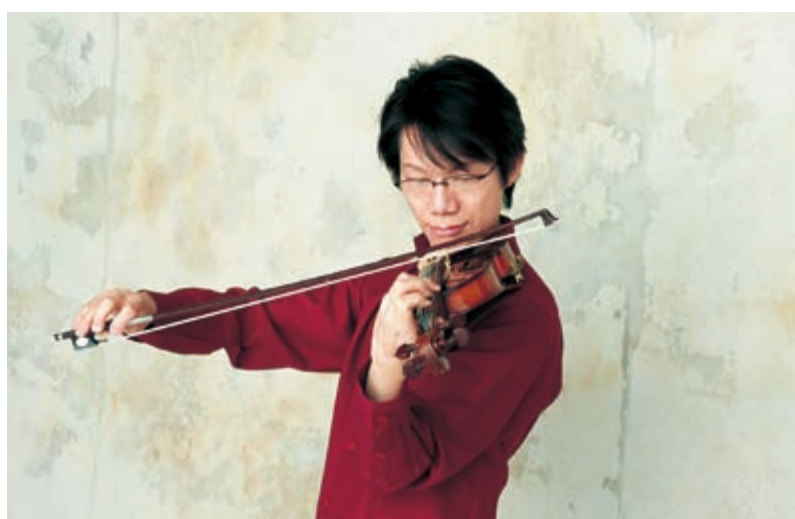
川島成道(ヴァイオリニスト)

いわみ芸術劇場新年度第一弾は5月の「ビリー・バンバンコンサート」です。菅原孝(兄・ヴォーカル)、菅原進(弟・ヴォーカル/ギター)の兄弟デュオビリー・バンバン。1969年にシングル「白いブランコ」でデビューし、いきなりの大ヒット。1972年には第23回NHK紅白歌合戦にも出場しました。現在、酒造メーカーのCMソングでも有名な「また君に恋してる」がロングセラー中。そんな実力派アーティストの待望のコンサート開催です!