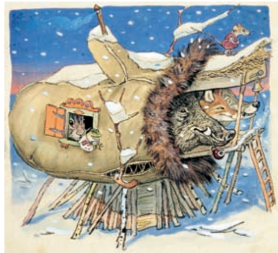
エフゲーニー・ラチョフ『てぶくろ』より(1950年)