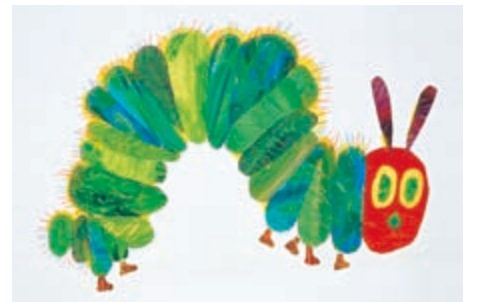
エリック・カール『はらぺこあおむし』のイメージ(1999年)