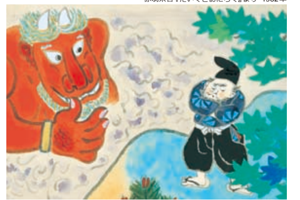
赤羽末吉『だいくとおにろく』より 1962年