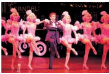
これまでの公演より

広く、楽曲は国内外で演奏されています。当劇場においては「いわみ合唱塾」に毎年新曲をご提供いただいています。またグラントワが所在する益田市の市歌や島根県立大学の校歌も作曲されており、地元の方にとっては大変馴染み深い先生でもいらっしゃいます。