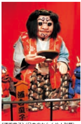
《酒呑童子》(日本のからくり人形展)