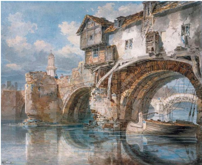
J.M.W. ターナー 《旧ウェルシュ橋、シュロップシャー州シュールズベリー》 1794年 ヴィットワース美術館蔵