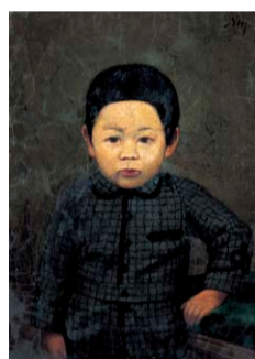
原田直次郎 《男児肖像》 明治20年代頃

男の子が真正面を向き、大人のようにポーズをとっています。着ている洋服から裕福な家の子であることがわかりますが、姿勢は静止したままの写真のように不自然で硬く、表情もどこかこわばって見えます。しかし顔の描き方がリアルなためか、まっすぐこちらを見る瞳に自然に目が吸い寄せられます。原田直次郎は、明治期に生きた洋画家です。ドイツ・ミュンヘン時代に知り合った森鷗外との交友でも知られますが、写実性の高い優