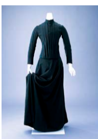
《女性用乗馬服》1888年頃