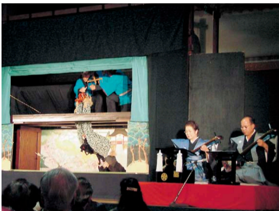
益田系操り人形(平成23年11月香川公演の様子)