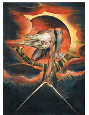
ウィリアム・ブレイク 『ヨーロッパ』図版1、絵巻、《日の老いたる者》 1827年? ヴィットワース美術館蔵

そうですね。油彩画よりも画材が携帯するのに適していたために、旅をした画家の風景画が多いのですが、人物画や静物画、物語の一場面を描いたものも展示されます。また本展の英語のタイトルは、The Real and the Imaginedで、「実在するものと心に思い描くもの」という意味です。風景を描くにも、実際