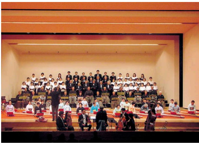
平成23年 島根邦楽集団 東西交流演奏会

さらなるレベルアップを目指して 島根邦楽集団のために作曲された曲「飛翔」にちなみ、更に大きく「飛翔」すべくステップアップを目指します。