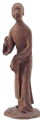
米原雲海 せんたん 《仙丹》 明治43(1910)年

少し目を細めて写真の作品をぼんやり見てください。影として浮かんでくるのは全体に丸みのあるフォルム。丸顔で垂れ目、なで肩。やや前屈姿勢で右手に持った何かを見せようとしているようです。次に目をこらして細部に注目してください。シンプルな中国服のなめらかな曲線、指の1本1本も繊細な作りで、華奢で優しげな少女だとわかります。いわば体全体でその「表情」が作られています。これが木を彫って作った彫刻で、高さ35セ