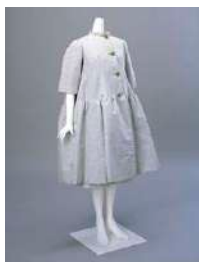
クリストバル・バレンシアガ 《コート・ドレス》1958年 島根県立石見美術館蔵

コレクション展 「布地とデザイン」 6月6日(木)~7月6日(土) 会場:展示室A