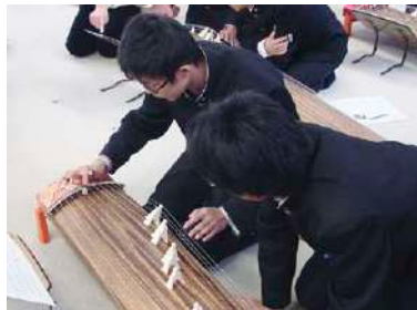
邦楽アウトリーチで箏を演奏

箏のアウトリーチで訪れた中学校では、目の前で演奏を聴いた生徒が「ぜひ箏を演奏したい」と意欲を燃やし、地元邦楽関係者の協力のもと練習を重ね、ついに文化祭で箏の演奏を披露す