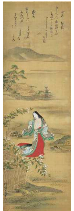
月岡雲鼎 《定家詠十二ヶ月花鳥人物図屏風》(部分) 個人蔵

和歌が元ネタになっている絵が、結構あるんです。ほかの絵画作品と同じ図柄のものを選んで展示しますので、「これの仲間は何かな？」と、ゲーム感覚で探してみてください！