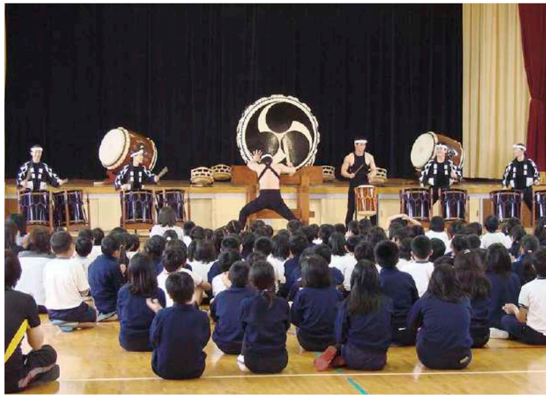
昨年の太鼓芸能集団 鼓童による交流学校公演の様子

ジャズ、箏、尺八、和太鼓など、様々なジャンルのアウトリーチを行ってきました。劇場とは違って間近で演奏を聞き、楽器に触れ、いつもはステージの上にいる演奏家と直接話することができるLive感があります。