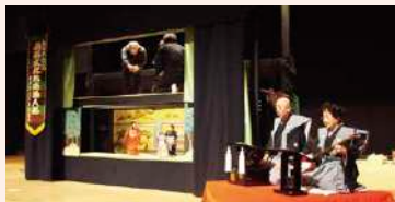
益田糸操り人形定期公演

グラントワ前身の石西県民文化会館の館長に就任したとき、まず始めに伝統芸能の益田糸操り人形の保存継承事業に取り組みました。次に地元島根出身の芸術家を指導者に迎え人材育成事業に着手。「合唱塾」「邦楽塾」など「塾」の名称で様々なジャンルのワークショップを展開し、それがグラントワのフランチイズ楽団となりました。その時まいた種が今、「あらたな人材」という苗に育ちました。受賞の報に接し地元関係者とスタッフの皆さんに感謝とエールを送ります。