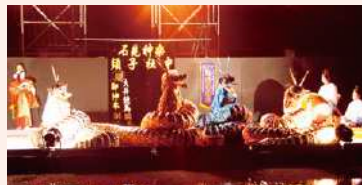
グラントワ中庭広場での石見神楽公演

この度の受賞は、地元の方々と共に様々な文化活動に取り組んできたことが評価されたものであり、皆様のサポートあってのことと考えております。グラントワは美術館と劇場が一体となった県西部の芸術文化の拠点施設として2005年に開館して以来、すでに260万人のお客様にお越しいただいております。再来年は開館10周年を迎える記念の年。今回の受賞を励みとして、今後益々市民参加型の文化活動に力を入れ、文化薫る街づくりに取り組んでまいります。