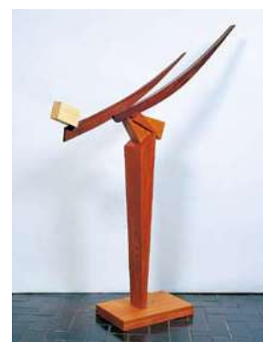
澄川喜一 《そりのあるかたち05》 2005年 個人蔵

抽象彫刻は、一種、無駄な物をそぎ落とす、あるいは最初から与えないで始まるもの、と捉