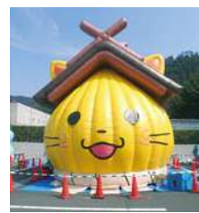
しまねっこ「ふわふわドーム」

このほかにもグラントワ全館を使って様々な催しを開催。文化芸術の秋、味覚の秋、「きんさいデー」に、ご家族そろって遊びにきんさい!