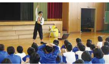
パントマイムショーの様子