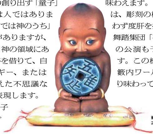
藪内佐斗司《守銭童子》2009年 個人蔵

他にも人体を生命がまとう「鎧」という観念で表した作品など、楽しいなかにもどこか不思議な余韻を残す独特の世界観が味わえます。また会期中には、彫刻の枠を超え、思わず度肝を抜かれる仮面舞踏集団「平成伎楽団」の公演も予定しています。この機会に多彩な藪内ワールドをたっぷり味わってください。