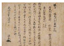
《益田神楽(鎌倉)議状》 1383年 東京大学史料編纂所蔵

特別展 「益田家文書に見る中世益田の館・城・湊」 10月15日(水)〜 11月24日(月) 会場:展示室A