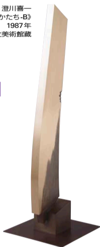
澄川喜一 《そのあるかたち-B》 1987年 島根県立美術館蔵