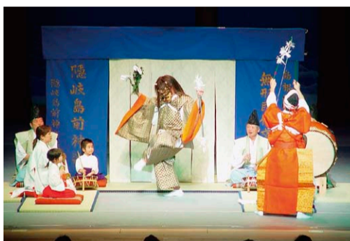
島根県無形民俗文化財 隠岐島前神楽(2005年度公演より)