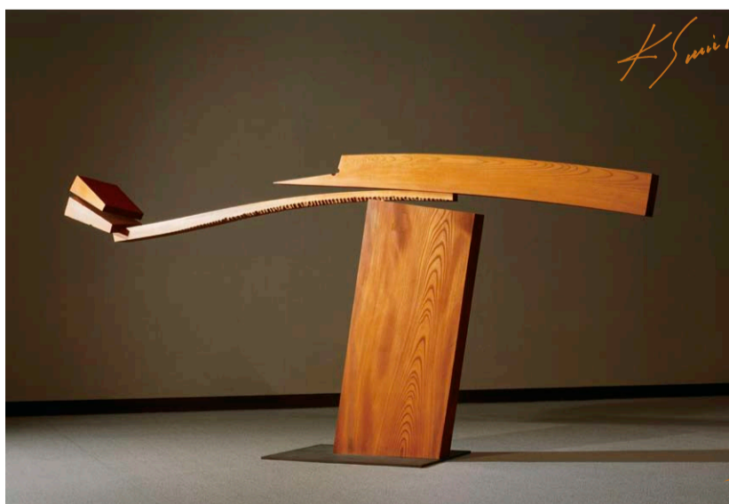
澄川喜一《そのあるかたち》1980年 埼玉県立近代美術館蔵

2015年 7月11日（土）～8月31日（月） 開館時間／10時～18時30分（展示室の入場は18時まで） 休館日／毎週火曜日 島根県立石見美術館 島根県芸術文化センターGrantワ内