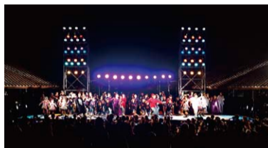
いわみダンスプロジェクト

夏の暑さを吹き飛ばす、エネルギーギッシュなダンスプロジェクト。ぜひご家族そろってお楽しみください!