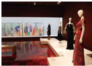
「開館5周年記念 5人の学芸員が選ぶベスト5!」展示風景