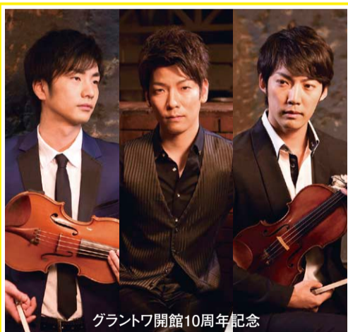
グラントワ開館10周年記念