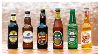
ラベルを眺めているだけでも楽しい様々なビール

「ビールまつり」を開催します! 地ビールをはじめ、世界各地のビールたちが真夏の乾いた喉を潤してくれますよ! また、ビールにピッタリ合うおつまみや、お子様も大好きなかき氷などの飲食ブースもご用意してお待ちしています。今年のお盆も、ぜひご家族そろってグラントワで楽しいひとときをお過ごしください。