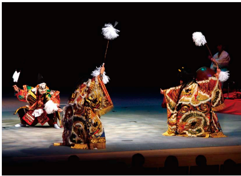
島根県立益田養護学校神楽クラブ(2006年度公演より)

島根県内各地で脈々と受け継がれてきた、島根が誇る伝統芸能「神楽」。本フェスティバルでは、その未来を担う子どもたちに焦点を当て、県内各地に伝わる神楽を一堂にご紹介します。