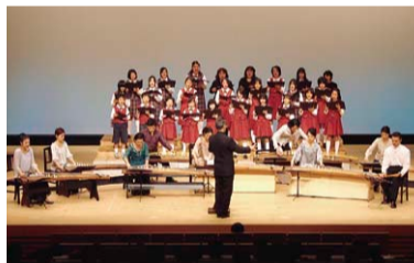
総括コンサート(2009年の公演より)

* (一財)地域創造…1994年、「地方団体の要請に応じて芸術文化の振興による創造性豊かな地域づくりを支援すること」を目的として設立。クラシック音楽、演劇、コンテンポラリーダンスなど様々な分野で地域のホールとアーティストがタッグを組んでおこなう事業などを実施している。