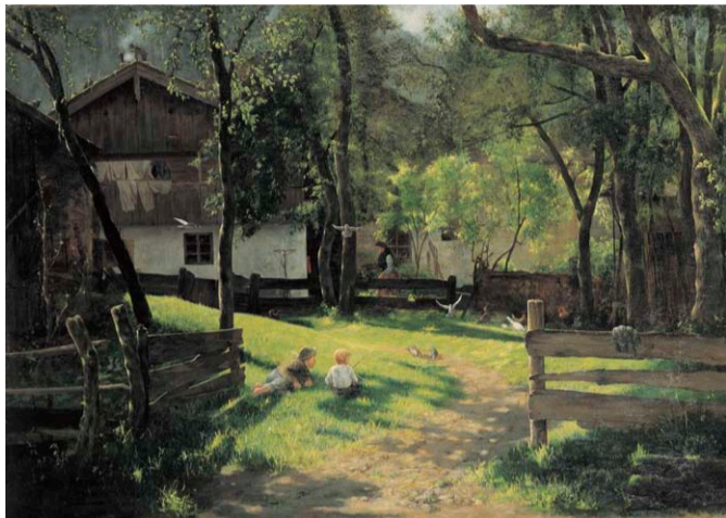
原田直次郎《風景》1886(明治19年) 岡山県立美術館蔵