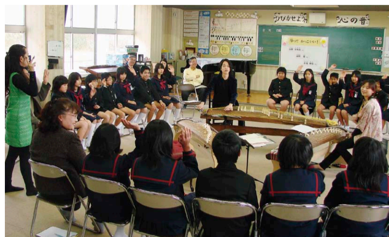
邦楽地域活性化モデル事業(2009年の様子)

グラントワは、(一財)地域創造*とタイアップして「邦楽地域活性化事業」を展開します。箏、尺八、三味線など日本の伝統音楽の素晴らしさを地域の子どもたちや人々に体験してもらい伝えることが目的です。併せて地域の文化芸術を支える公立文化施設の活性化も目指しており、グラントワと石中央文化ホール(浜田市)、江津市総合市民センター(江津市)の3施設が協力し合って事業を進めていきます。