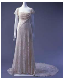
ジャン=フィリップ・ウォルト 《ウェディング・ドレス》 1916年

コレクション展 「ドレスの楽しみ」 8月3日(水) ～9月26日(月) 会場:展示室B