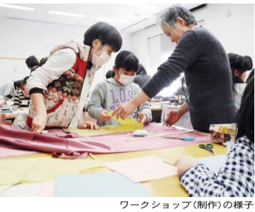
ワークショップ(制作)の様子

企画展「こどもとファッション」の関連イベントとして、子ども服飾デザイン研究室 Vol.2「子ども服を作ろう」を実施しました。このワークショップは小中学生が対象。小学1年から中学1年までの17名が2月28日から約一か月にわたり服をデザインし、布を裁ち、縫って服を形にし、その成果を発表としてファッションショーをしました。