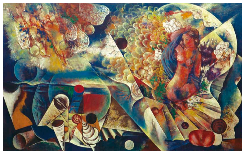
川口軌外《少女と貝殻》1934(昭和9)年 油彩・カンヴァス 和歌山県立近代美術館蔵