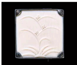
ダゴベルト・ベッヒェ《アローチ》 1916年 当館蔵

コレクション展 「□△○—まるさんかくしかく—」 5月23日(水) ～7月16日(月・祝) 会場:展示室A