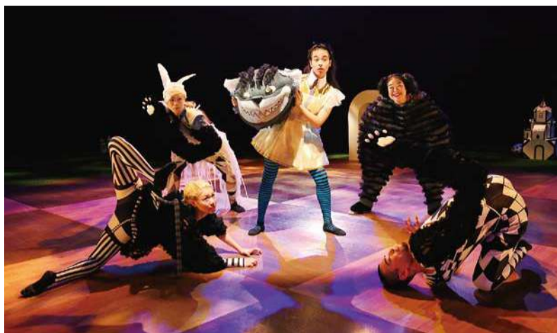
KAATキッズ・プログラム「不思議の国のアリス」2017年上演より

不思議で愉快なダンサーたちが、 アリスの世界に勢ぞろい。 扉の向こうは、摩訶不思議でナンセンス。 奇想天外オドリです！