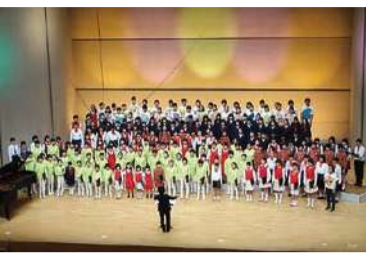
出演者全員による合同演奏

3月25日、「グラントワ・ジュニア・コーラスフェスティバル2018」を開催しました。合唱を通じて子どもたちが交流を深めていくことを願って企画したもので、地元益田市の3つの小学校の合唱部合同ユニット リトル☆スターズとグラントワ・ユース・コール、広島県からみよし KIRIRI 児童合唱団、山口県から岩国市ジュニア合唱団、みずみ少年少女合唱団、お隣浜田市から浜田少年少女合唱団、そしてゲストに東京からむさし野ジュニア合唱団「風」が出演し、総勢約200人の子どもたちが集まりました。