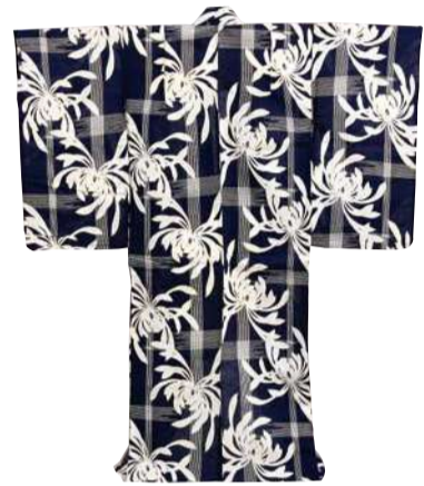
《紺木綿地破格子菊模様浴衣》 昭和時代 20世紀 東京家政大学蔵【前期】

ラックスした場にふさわしい、楽しくおおらかな図案があらわされるようになります。同じ頃、国内で木綿の生産が盛んになり、それまで麻で作られていた庶民の衣服が綿にとって替わり、ゆかたも綿を素材とするようになりました。やがて、ゆかたは夏場の銭湯への往来や、花火見物や盆踊りなど夏のイベント時にも着られるようになり、江戸時代後期には、夏の気楽な外出着として定着していきました。