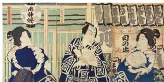
豊原国周《御風呂高仰環帯》 江戸時代 慶応3年(1867) 個人蔵【通期】

現在人気のあるブランドのゆかたなどを、前期と後期に分けて展示します。藍と白で表される、軽妙でおおらかな、かつ洗練されたゆかたは、わたしたちにとっても実に魅力的です。そう感じるの、いわゆるハレとケの服の違いがなくなりつつあり、カジュアル化のすすむ現代のファッションへの意識と共通するものを、ゆかたに見出せるからかもしれません。