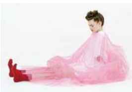
THERIACA (Sofa(ソファ)) 2018年

特別展 「THERIACA 服のかたち／体のかたち」 2018年7月27日(金)～9月9日(日) 展示室C