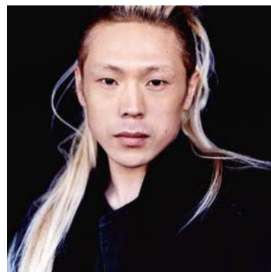
森山開次(ダンサー・振付家) ©石塚定人

神奈川芸術劇場(KAAT)が毎年力を入れているキッズプログラムとは？ 世界の文化都市横浜よりお贈りする、おとなもこどもも楽しめるキッズプログラム！第一線で活躍するアーティスト・クリエイターとともに、真にクリエイティブで良質な作品をプロデュースしています。