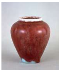
河井寛次郎《精紅瓶》 1921年頃 島根県立美術館蔵

特別展 「島根県立美術館 コレクション 色あそびの世界」 7月20日(金) ~9月17日(月・祝) 会場:展示室A・B