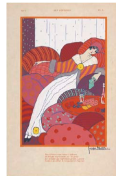
ジョルジュ・ルパップ 《クッション》

鮮やかな色のクッションと、それらに身をあずけている女性が目に飛び込んできます。女性の上着は周囲に溶け込むような図柄で描かれ、下に着ているドレスの質感が際立って見えます。身体を包み込むようなシルエットのドレスは、当時の最新流行のもの。20世紀初頭まで西洋の女性達はコルセットで腰を強く締め上げたドレスを着用していましたが、1900年代にそれを用いないドレスが提案されると、このような女性服が着られるよ