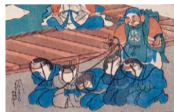
作者不詳 《鮫の流しもの》(部分) 安政2年(1855) 島根県立古代出雲歴史博物館蔵

特別展 「浮世絵にみる遊び心」 —島根県立古代出雲歴史博物館コレクション— 9月20日(木)~11月5日(月) 会場:展示室A