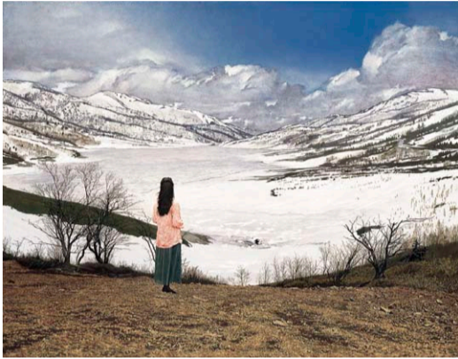
大畑 稔浩《春の予感》1993年 東京ステーションギャラリー蔵

めがね、それは 見えないものを見るための、 世界ののぞき窓。 美術もまた、私たちが 世界を知るための窓である。