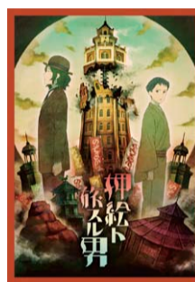
塚原重義 / やほみ《押絵ト旅スル男》イメージイラスト ©「めがねと旅する美術展」実行委員会/トワフロ

新作アニメ 《押絵ト旅スル男》 2018年9月15日(土)～11月12日(月) 企画展「めがねと旅する美術展」 展示室にて 会期中毎日ループ上映