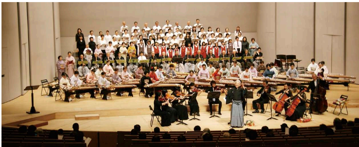
10周年記念演奏会の様子