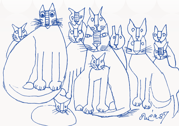
猪熊弦一郎 題名不明 1987年 丸亀市猪熊弦一郎現代美術館蔵 ©The MIMOCA Foundation