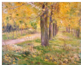
黒田清輝 《ボアの黄葉》 1891年 当館蔵

コレクション展 「森鷗外と帝国美術院の芸術家たち」 7月10日(水)～9月2日(月) 会場:展示室A