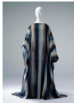
ダゴベルト・ペツィエ 《カフタン》 1919年頃 当館蔵

本作はそうした時期に制作されたもの。テキスタイルは20世紀初頭にウィーンで結成された