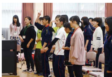
ネクスト・クワイア合唱の様子

語りつくせませんが本日はここまで。皆さん、グラントワの事業にどうぞご支援をください。これからの時代を、日本を、そして世界を豊かなものにしましょう！