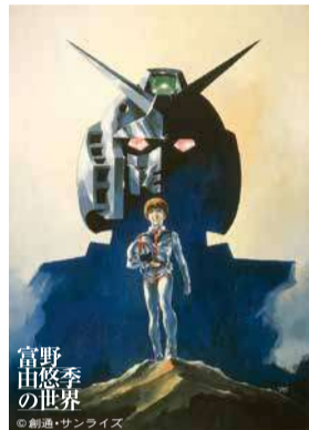
安彦良和 イラスト原画 『機動戦士ガンダム(劇場版)「蒼き流星」』

富野監督といえばガンダム、ガンダムといえばメカアクション、というイメージをお持ちの方が多くでしょう。ロボットどうしの戦闘に重ねて、人と人との感情のぶつかり合いや共鳴を表現する演出、そこで展開される独特のセリフ回しなどが、富野作品の魅力です。