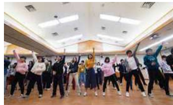
練習中の様子

とりわけ音楽家を多く輩出している県です。もともと持っている声に恵まれている地域だと思います。東部だけではなく、島根県全体が「合唱県」「音楽県」になることを私は願っています。もちろん、コンクールで輝かしい成績をおさめることも素晴らしいことですが、それとは少し違うムーブメントである「ネクスト・クワイア」が、その大きな契機になれば、こんなに嬉しいことはありません。パワー全開の「ネクスト・クワイア」を応援してください!