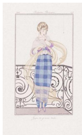
(右) ゲルダ・ヴェイナー 厚地のトワルのスカート『ジュルナル・デ・ダム・エ・デ・モード』Pl.173. 1914 年