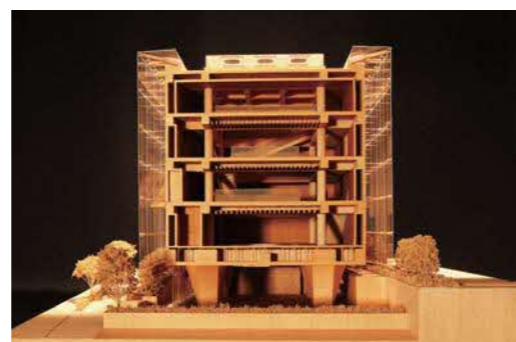
紀尾井清堂 (模型) 2021年