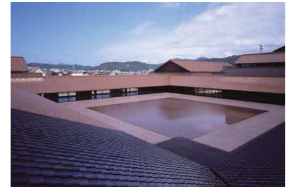
島根県芸術文化センター「グラントワ」(外観写真) 2005年