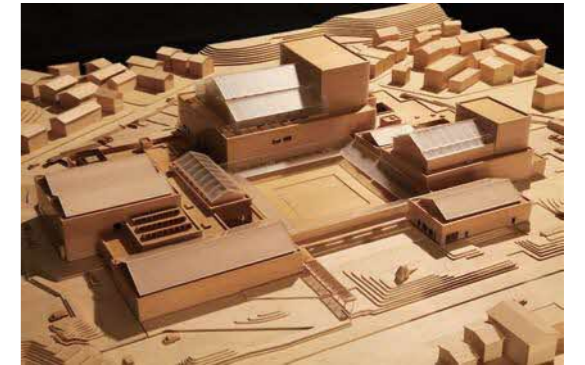
島根県芸術文化センター「グラントワ」(模型) 2005年