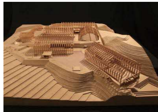
海の博物館 (模型) 1992年