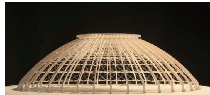
Unbuilt/こまつドーム (模型) 1994年

講演会や建築ツアーなど、内藤廣本人が登壇するプログラムを複数開催します。詳細は今後、展覧会チラシ、グラントワホームページ等で発表します。