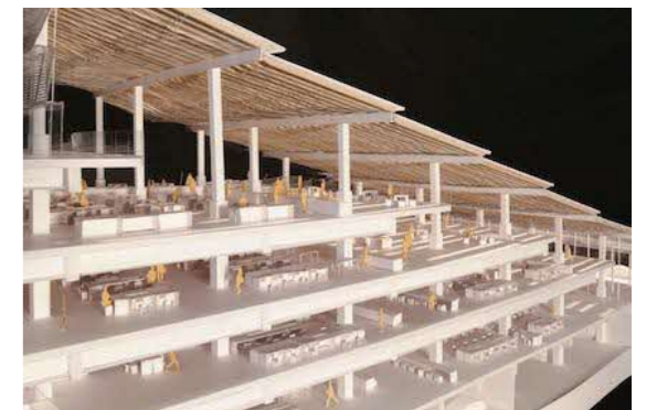
Unbuilt/日立市庁舎 (模型) 2012年