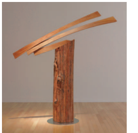
澄川喜一《そのあるかたち97-3》 1997年 当館蔵

澄川喜一(1931年～)は島根県吉賀町生まれの彫刻家です。本展では島根県に寄贈された、約100点の作品群から選りすぐりの彫刻作品と、屋外彫刻の図面・スケッチ・下絵・デザイン・絵画など「澄川喜一の仕事」を紹介します。