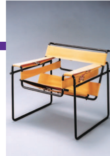
マルセル・ブロイヤー 《クラフチェアB3(ヴァンリーチェア)》 1925年 豊田市美術館蔵

1910-30年代のヨーロッパでは、アーティストたちが国やジャンルを超えて交流し、建築やインテリア、衣服、印刷物などで、その後の画期となるようなユニークな作品を多数生み出しました。本展では彼らの交流と情報の流通に注目し、新しい造形と思想が探求されたさまを紹介します。