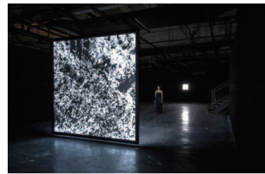
平川紀道《a study for spacetime》2019年

石見出身の平川紀道と野村康生による二人展。それぞれの新作を発表するほか、共同で手がけるインスタレーションも展開します。アートとサイエンスの領域をまたぎ、国内外で活躍する気鋭のアーティストが、作品を通して私たちの感覚を刺激し、未来について考える手がかりを提示します。