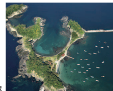
松江泰治《JP-32 07》2018年 当館蔵

国内外の地表を独自の視点で切りとる写真家、松江泰治が島根県を空撮したシリーズ、全40点を紹介。私たちが暮らす土地の、これまで気づけなかった姿が明らかになります。