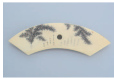
巖水《石見根付 扇面に忍草》江戸時代 当館蔵

4月27日(水)～6月20日(月) 展示室B 超絶技巧とは、本来高度な演奏技術のことですが、最近は工芸分野でも使用されます。男性が留め具として使用した根付には驚くほど細かい文字が彫られるなど、超絶技巧の宝庫です。