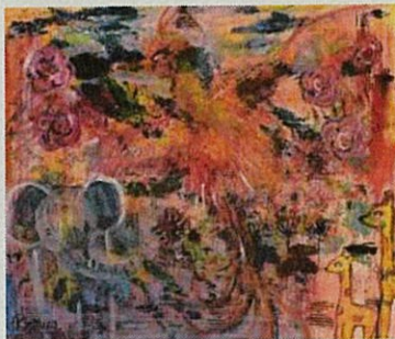
【銀賞】「Breathe back」 柏原 佑佳