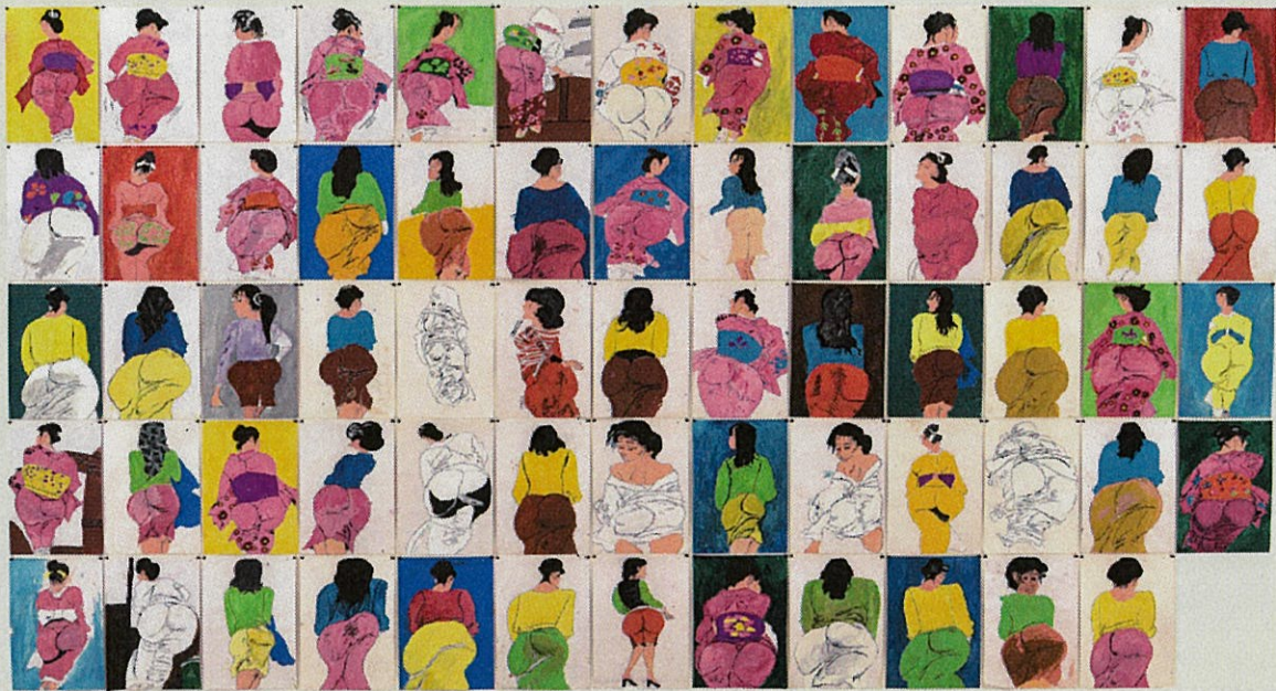
【金賞】「お尻コレクション」 清水 信博