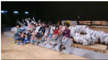
石見神楽のオロチを新聞紙でつくってみよう！