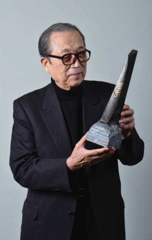
澄川喜一