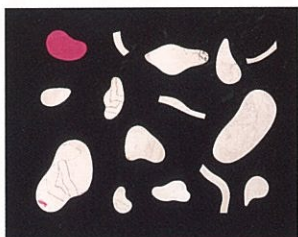
《三越包装紙「華ひらく」型紙》1950年