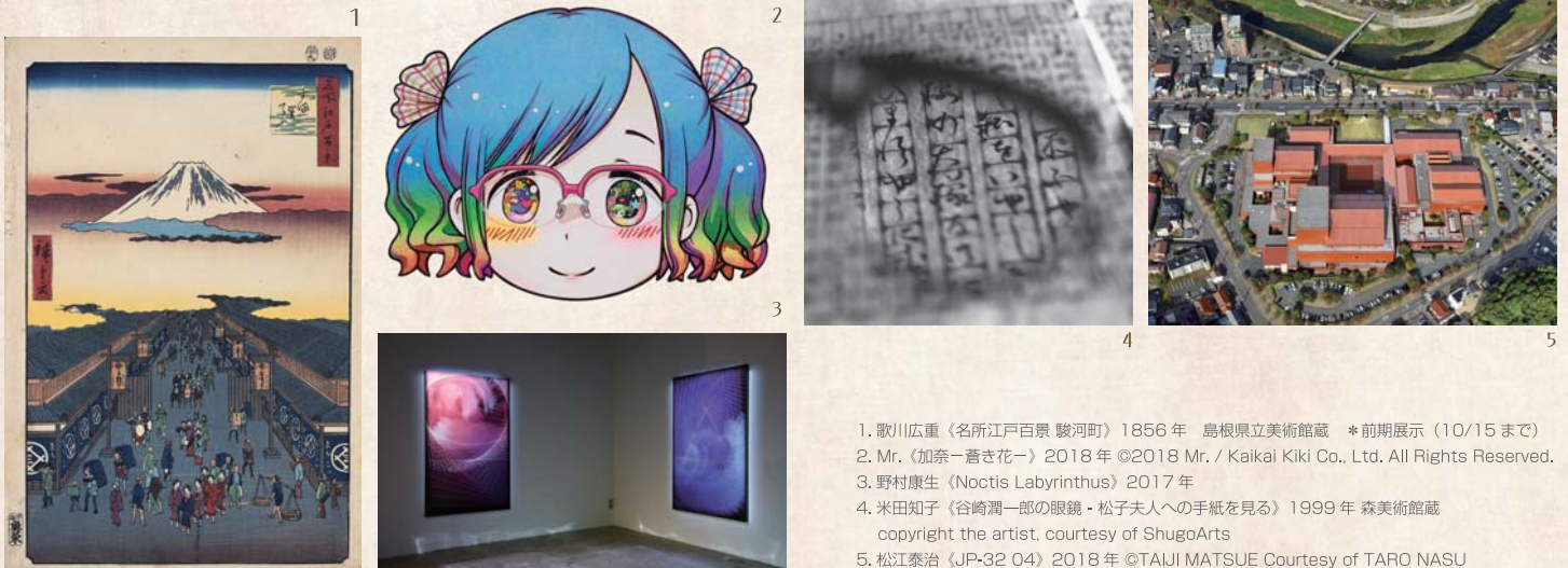
1. 歌川広重《名所江戸百景 駿河町》1856年 島根県立美術館蔵 *前期展示(10/15まで) 2. Mr.《加奈—薔き花—》2018年 ©2018 Mr. / Kaikai Kiki Co., Ltd. All Rights Reserved. 3. 野村康生《Noctis Labyrinthus》2017年 4. 米田知子《谷崎潤一郎の眼鏡・松子夫人への手紙を見る》1999年 森美術館蔵 copyright the artist, courtesy of ShugoArts 5. 松江泰治《JP-32 04》2018年 ©TAIJI MATSUE Courtesy of TARO NASU

「めがね」は「みる」ことを補助する器具ですが、本展ではこれを、世界を知るための、あるいは見えないものを見るためののぞき窓としてとらえます。アーティストたちが広い世界を、あるいは見えない世界を表すために制作した美術作品もまた、私たちに様々なイリュージョンを見せてくれる「めがね」といえます。展示室には、遠く離れた景色を望遠鏡のように間近に見せる風景画や、普通では見えないものを露わにする透視図、レンズや錯視の効果を利用した「だまし絵」、最先端のVR（ヴァーチャルリアリティー）など、江戸時代から現代までの多彩な作品が一堂に会します。