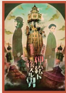
塚原重義 / やほみ 《押絵ト旅スル男》イメージイラスト ©めがねと旅する美術展実行委員会 / 塚原重義 / トワフロ

監督：塚原重義 / キャラクターデザイン・作画監督：やほみ 音楽：アカツキチョータ / 声の出演：細谷佳正、梶裕貴、坂本頼光 プロデューサー：迫田祐樹 / 企画：トリメガ研究所(川西由里、工藤健志、村上敬) 原作：江戸川乱歩「押絵と旅する男」