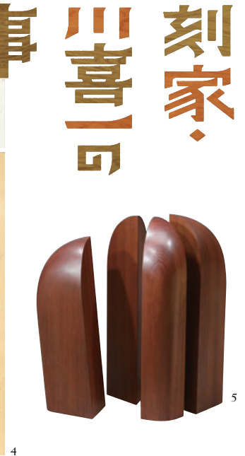
1. 澄川喜一 デザイン監修した東京スカイツリー®と作品「TO THE SKY」の前で/2.《そのあるかたち01-2》2001年 3.《OROCHI》(当館所蔵のモニュメント 構想段階の下絵) 2005年頃/4.《焼失した谷中五重塔のスケッチ》(スケッチブックより) 1957年頃/5.《SCULL》制作年不詳