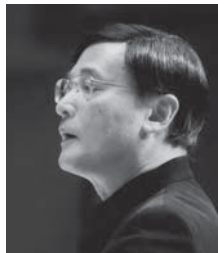
勝部俊行 合唱指揮者