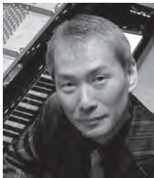
寺嶋陸也 作曲家・ピアニスト